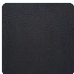
Cuir nappa noir